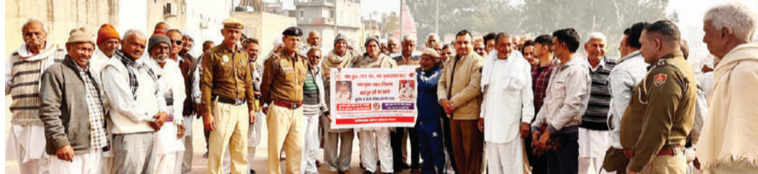
नशा ना करने बारे जागरूक करती कैथल पुलिस टीम।