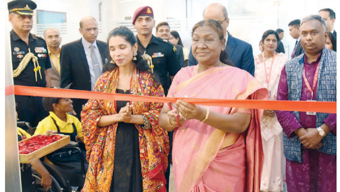
हैदराबाद में सिकंदराबाद स्थित राष्ट्रपति निलय में राष्ट्रपति द्रौपदी मुर्मू विभिन्न पहलों का शिलान्यास करती हुई।

अमित शाह ने कहा कि बाबा साहब के न रहने के बाद भी कांग्रेस ने कभी बाबा साहब को इज्जत नहीं दी। पंडित जी (नेहरू) की कितनी ही किताबों में लिखा है कि उन्होंने कभी बाबा साहब को सही जगह नहीं दी। कांग्रेस ने बाबा साहब को भारत रत्न नहीं दिया। पंडित नेहरू ने खुद को भारत रत्न दिया।