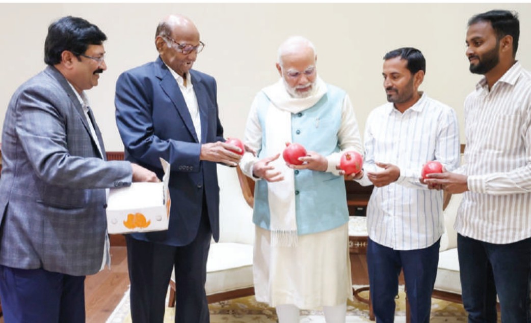
नई दिल्ली। राज्यसभा सांसद और पूर्व केंद्रीय मंत्री शरद पवार किसानों के एक समूह के साथ