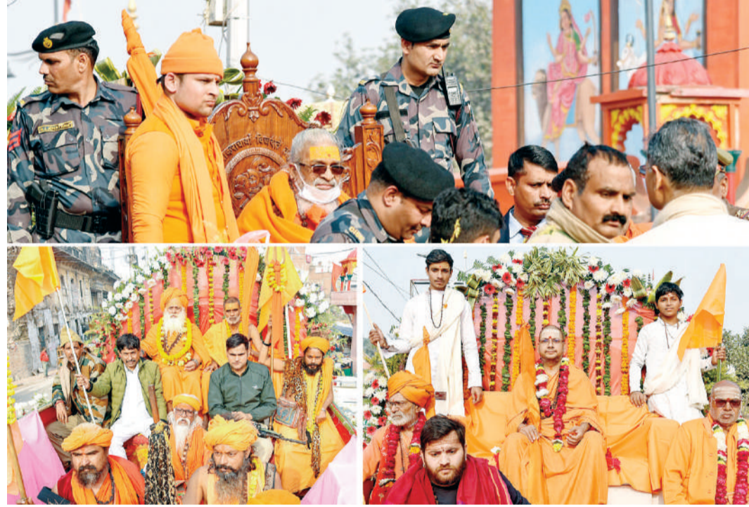
उत्तर प्रदेश के प्रयागराज में महा-कुंभ मेला 2025 से पहले साधु नगर प्रवेश जुलूस में भाग लेते हुए।