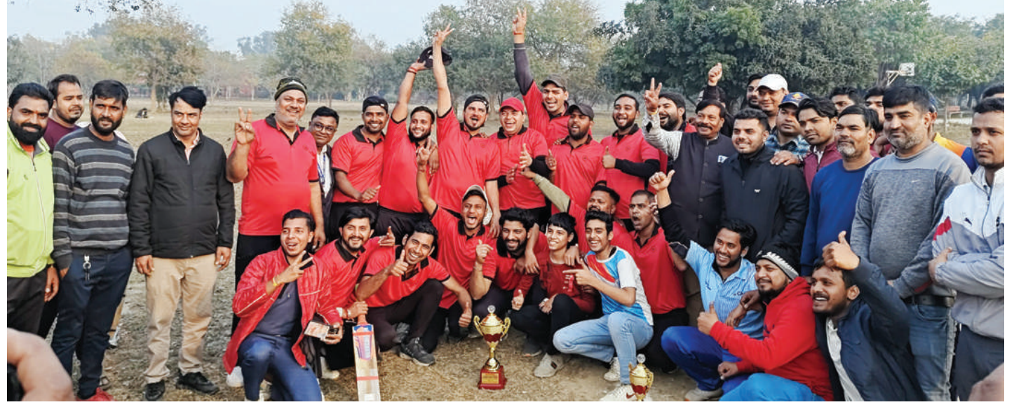
दिल्ली में तीसरा हैल्थ वॉरियर क्रिकेट टूर्नामेंट का 15वां मैच व फाइनल मुकाबला GTBH और RGSS के बीच खेला गया जिसमें RGSS ने जीत अपने नाम दर्ज किया। इस मौके पर अपनी खुशी को जाहिर करते हुए खिलाड़ी व अन्य।