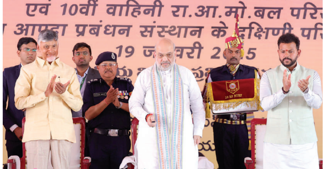
आंध्र प्रदेश के विजयवाड़ा में केंद्रीय गृह एवं सहकारिता मंत्री अमित शाह राष्ट्रीय आपदा प्रबंधन संस्थान के दक्षिणी परिसर, एनडीआरएफ की 10वीं बटालियन और गैसनल रिसर्च सेंटर के सुपोल परिसर सहित लगभग 220 करोड़ रुपये की विभिन्न परियोजनाओं का उद्घाटन और शिलान्यास करते हुए।