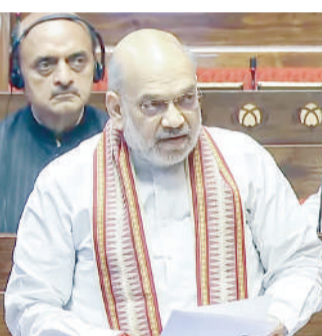
आपगी। जो करना है, हमें करना है। शाह ने कहा कि 2005 में पहली बार आपदा प्रबंधन अधिनियम लागू किया गया था।

(एजेन्सी)। नई दिल्ली। केंद्रीय गृह मंत्री अमित शाह ने आपदा प्रबंधन (संशोधन) विधेयक, 2024 पर राज्यसभा में चर्चा का जवाब दिया। उन्होंने कहा कि कुछ सदस्यों ने सवाल उठाया कि संशोधन की क्या जरूरत है। मैं उनसे कहना चाहता हूँ कि अगर समय रहते किसी इमारत की मरम्मत नहीं की जाती है तो वह गिर जाती है। विपक्ष पर तंज सकते हुए शाह ने कहा कि उन्हें लगता है कि शायद वे आकर इसे बदल देंगे लेकिन अगले 15-20 साल तक किसी की बारी नहीं आएगी। जो करना है, हमें करना है। शाह ने कहा कि 2005 में पहली बार आपदा प्रबंधन अधिनियम लागू किया गया था।