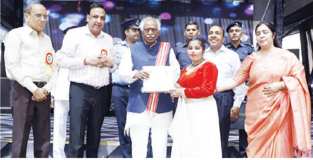
बचाओ और बेटी-पढ़ाओ अभियान को शुरू किया था। इसके साथ-साथ महिला सशक्तिकरण की दिशा में लक्ष्यित दीदी