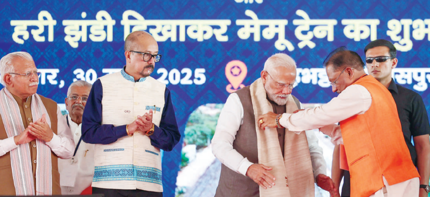
छत्तीसगढ़ के बिलासपुर में प्रधानमंत्री नरेंद्र मोदी विभिन्न परियोजनाओं के शिलान्यास, उद्घाटन और राष्ट्र को समर्पण कार्यक्रम में भाग लेते हुए।